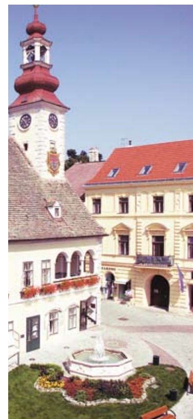
Um die historischen Bauten im Mödlinger Stadtkern zu schonen, werden die Überwachungsdaten per WLAN übermittelt, womit keine Stemmarbeiten für die Leitungsverlegung notwendig wurden.

Das Special Innovation entsteht mit finanzieller Unterstützung von ECAustria. Die redaktionelle Verantwortung liegt bei economy .