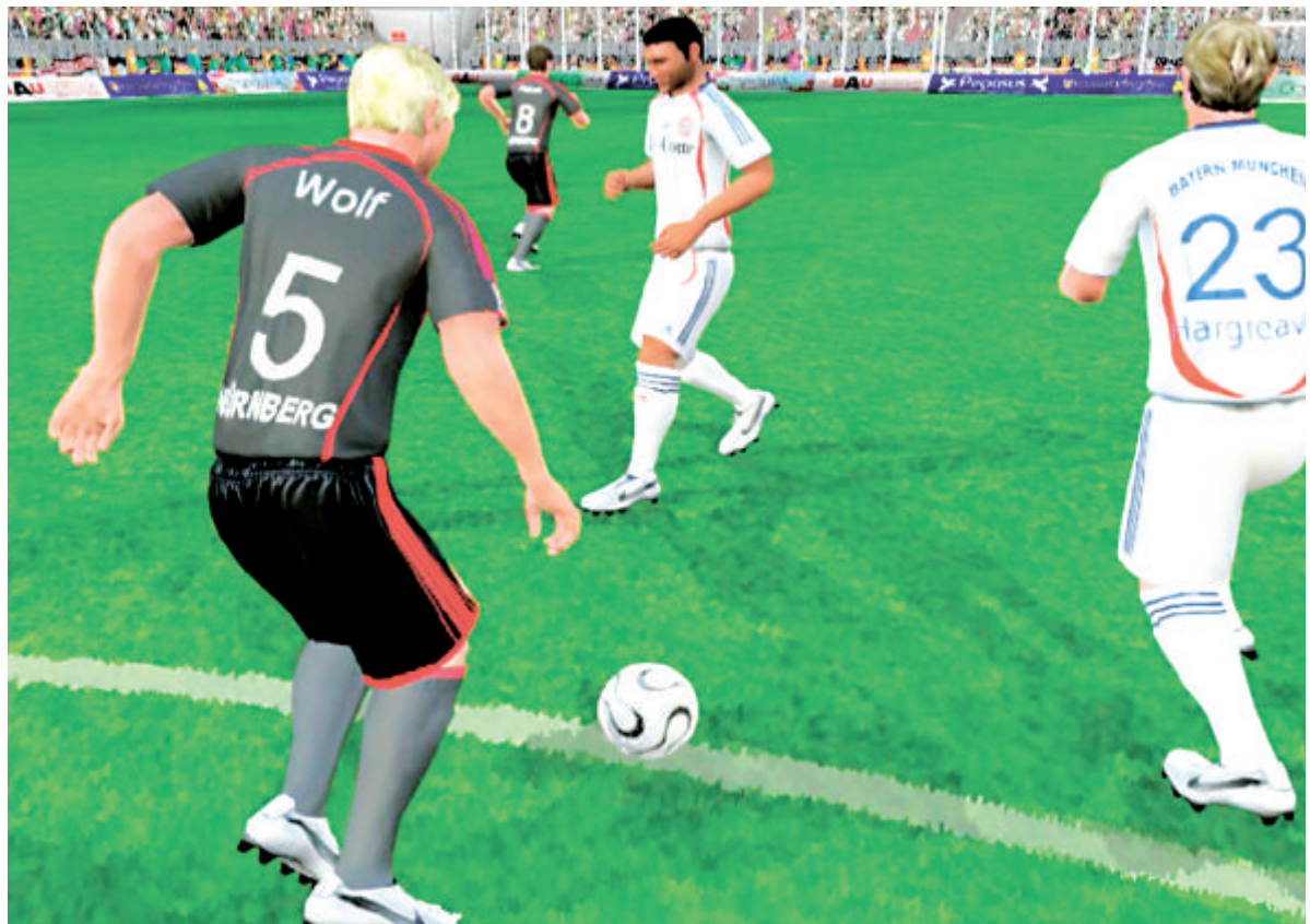
Das APA-Europaket hat's in sich: Fußballspieler kommen direkt aufs Handy. Alle Torszenen werden realitätsgetreu nachgestellt.

Bei der Video-Produktion liefern die Reporter der APA Clips von Fan-Meilen, Euro-Partys