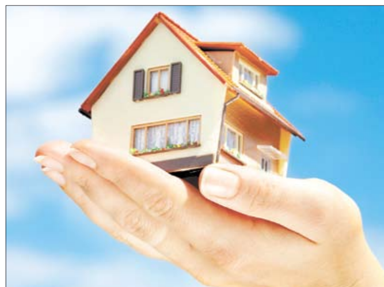
Leicht vermietbare Eigentumswohnungen in guten Lagen sind bei Investoren derzeit gefragt.

Besonders Vorsorgewohnungen sind seit der Finanzkrise vermehrt gefragt. Auf eigene Faust würden allerdings nur wenige eine Wohnung kaufen oder vermieten: „Immer mehr Menschen suchen Rat beim Makler, wie sie am besten vermieten können.“ In Hinblick auf die Finanzkrise sind Vorsorgewohnungen eine besonders empfehlenswerte Anlageform, wie Pisecky meint: „Selbstverständlich zahlt sich das aus, auch wenn es sich um eine mittel- bis längerfristige Bindung handelt.“ Selbst wenn sich die Immobilienpreise nur langsam